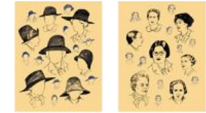
8 Josune Urrutia Las Sinsombrero 2: Ocultas e impecables (2018), de Tània Balló