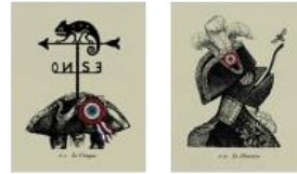
4 Pep Montserrat Fouché. Retrato de un hombre político (1929), de Stefan Zweig