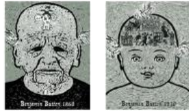
2 Alejandra Hidalgo El curioso caso de Benjamin Button (1922), de Francis Scott Fitzgerald