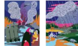
7 Mirjana Farkas Voces de Chernóbil. Crónica del futuro (1997), de Svetlana Alexiévich