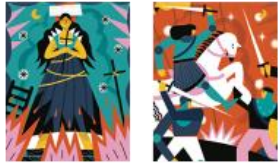
1 Arantxa Recio, Harsa Juana de Arco. La asombrosa aventura de la doncella de Orleans (1896), de Mark Twain