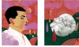
5 Maguma Mi último suspiro (1982), de Luis Buñuel