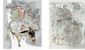
6 Raúl El Bajísimo (1992), de Christian Bobin